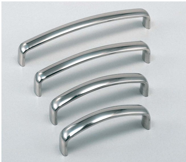
写真は鏡面研磨仕上げです。