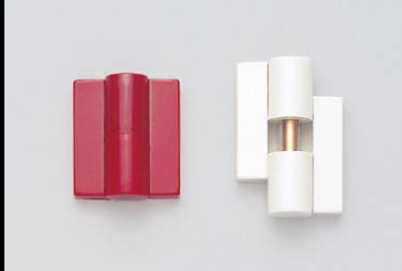
丁番 B9505-50型 P.885