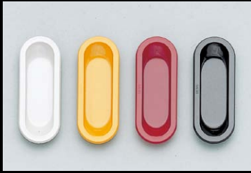
掘込取手 542型 P.82

本カタログに掲載している製品内容は、部品としての品質範囲です。この部品を使用した最終製品の機能・性能・安全を保証するものではありません。