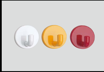
コートフック 477-90-010型 P.226