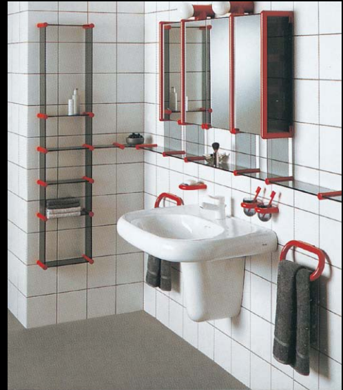
サニタリー No.200カタログ、2/3巻、P.690