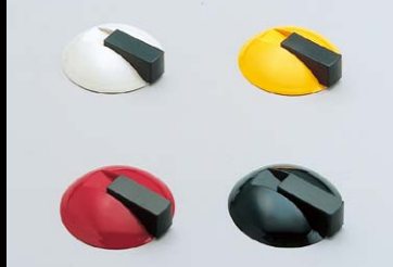
戸当り 625型 No.200カタログ、3/3巻、P.931