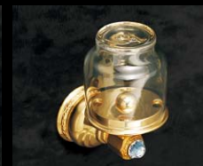
サンタリー No.200、2/3巻、 P.710~713