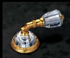
レバーハンドル・ドアノブ No.200、2/3巻、 P.620~621