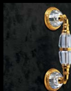
ドアハンドル No.200、1/3巻、 P.152~153