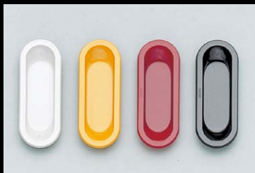
掘込取手 542型 P.82