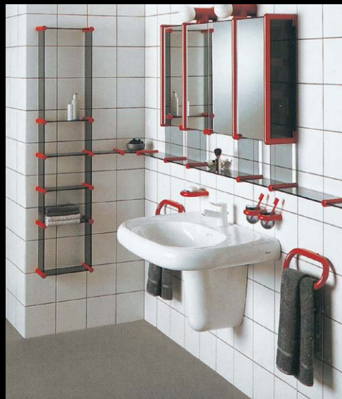
サニタリー No.200カタログ、2/3巻、P.690