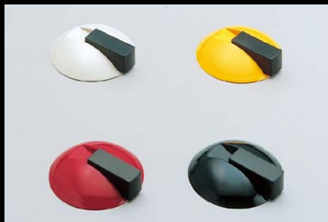
戸当り 625型 No.200カタログ、3/3巻、P.931