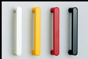
ハンドル 548型 P.48

本カタログに掲載している製品内容は、部品としての品質範囲です。この部品を使用した最終製品の機能・性能・安全を保証するものではありません。