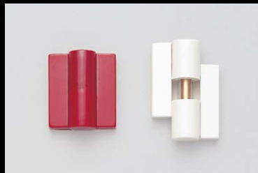
丁番 B9505-50型 P.885