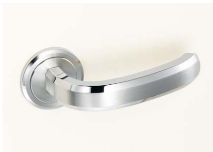
レバーハンドル ZL-1101、ZL-1102、ZL-1103 No.200カタログ、2/3巻、P.605～606