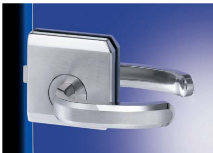
ガラスドア用ケースラッチ ZL-1601 No.200カタログ、3/3巻、P.72