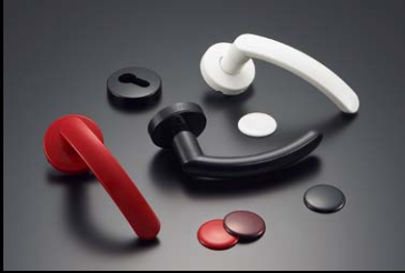
レバーハンドル 133R型 No.200カタログ、2/3巻、P.619