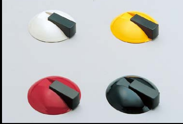
戸当り 625型 No.200カタログ、3/3巻、P.931