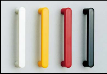
ハンドル 548型 P.48

本カタログに掲載している製品内容は、部品としての品質範囲です。この部品を使用した最終製品の機能・性能・安全を保証するものではありません。