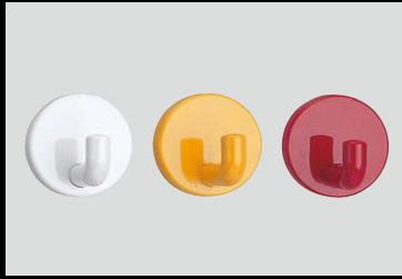
コートフック 477-90-010型 P.226