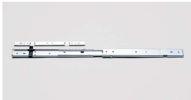
写真は右レールです。