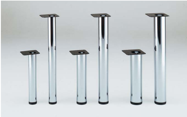
SY060(1) SY060(2) SY076(1) SY076(2) SY089(1) SY089(2)