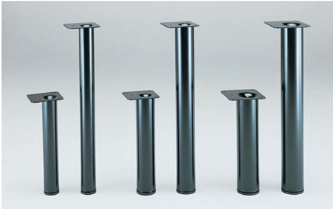
SY060(1) SY060(2) SY076(1) SY076(2) SY089(1) SY089(2)