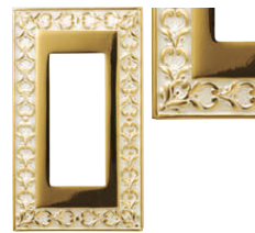
ゴールド ホワイト パティナ