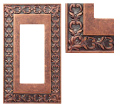
ラスティック カッパー