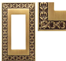
ブライト パティナ