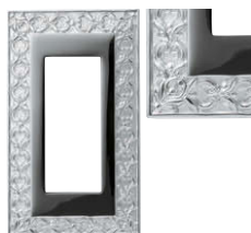
ブライト クローム