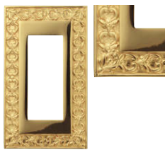
ブライト ゴールド