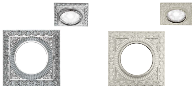
ブライト クローム