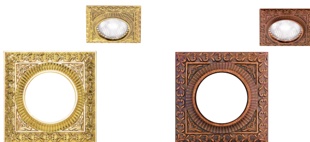
ブライト ゴールド