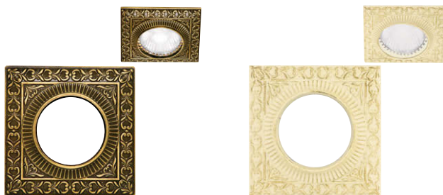
ブライト パティナ